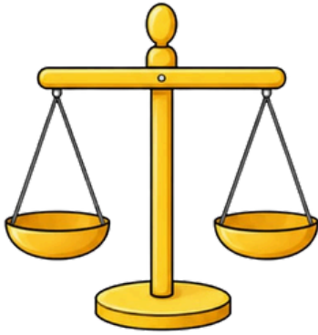
Eşit Kollu Terazi